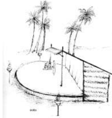
රංග භූමිය ඇඳ හම් කර තිබීම (ලකුණු 04 යි)

(ii) නාඩගමෙහි ප්‍රභවය කෙටියෙන් පැහැදිලි කරන්න.